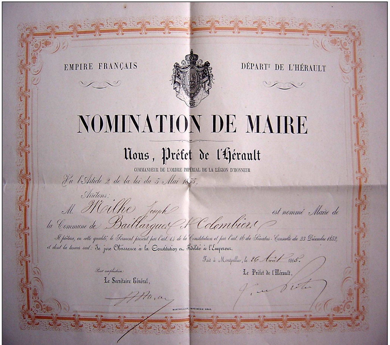
Nomination du maire (1865)